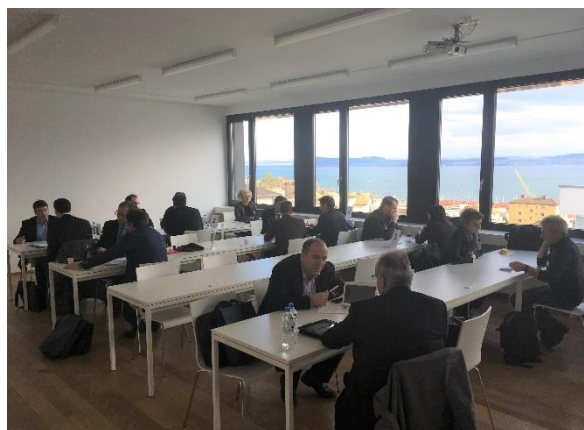
Créez des contacts fructueux et dialoguez avec vos partenaires de demain !